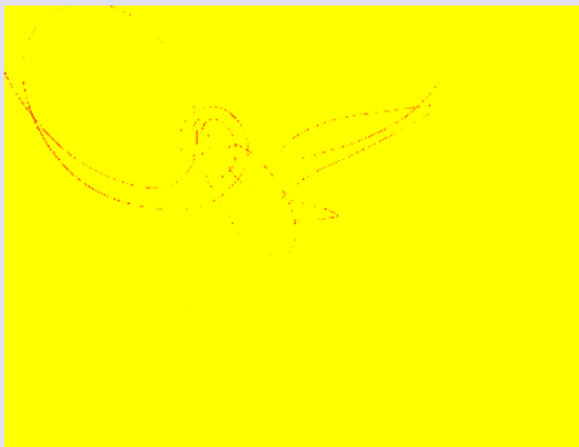
Lucio Fontana. Estructura de neón para la IX Trienal de Milán, 1951

En la propuesta para LIGA 20 me resuena el hacer y pensar de Lucio Fontana; en particular la espacialidad creada por aquellos neones moldeados como signos en el aire, perecederos e indelebles a la vez. Esta propuesta es también, y a su modo, una experiencia espontánea y fugaz, que a través de la reduplicación de imágenes presenta una situación multiplicada y ampliada. Una pieza estática que, sin embargo, produce una dinámica de constante movimiento a través de reflejos—intencionalmente—imperfectos,