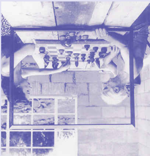
Max Ernst y Dorothea Tanning jugando al ajedrez. Arizona, 1948

present reality to a parallel one: pre-established values are blurred, the context is reconfigured, and a new situation is established. As well as extended and multiplied, the space is subverted. In my view, Nicolás Campodonico's proposal for LIGA oscillates between these artistic reference points. They serve to delimit the boundaries of a piece that takes on the ephemeral, dynamic, and ethereal aspects of Fontana's neon works, together with the manipulation and framing of Ernst. A new situation emerges from the alteration of the original values of the context, as in the case of overpainting, and invites us to experience a reality that appears both re-framed and displaced at the same time.