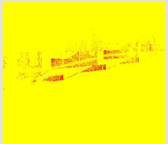
Marabajo, Cuatro casas en la Pedrera, Rocha, Uruguay, 2006