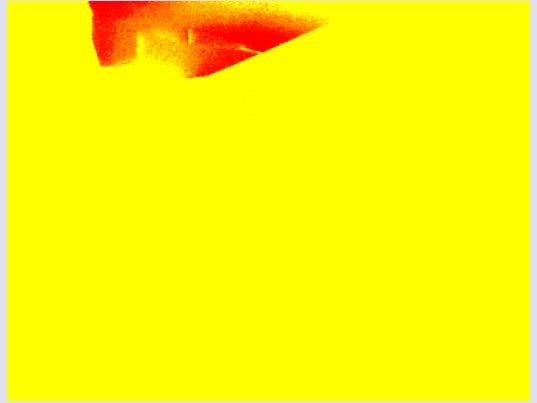
Consultorio Médico Álvarez, Rosario, 2002

I set out to write about the intervention in a space with windows, and I end up surrendering myself to an elegy on the multiple and the simultaneous. A window is always an occasion for imagining a place of observation, a privileged point of view to see things outside of ourselves as a spectacle. It is an architectural element that enables us to grasp, from the position we are in, everything around us. Experienced in this way, the recognition of what is surprising about reality becomes the principal theme of the profession of architecture. Carlos Emilio Gadda knew that in literature “to know is to insert something into reality, and thereby deforms reality.” Hence his typical mode of representation and the tension that he creates between himself and the things represented, so that the more the world is deformed beneath his gaze, the more he is committed to it. Introducing into this space a mysterious object, a metal sheet that is folded, multiplied, and deformed, carrying back and forth the occasional images that are produced beyond is a simple—and thus an exciting—intuition. An